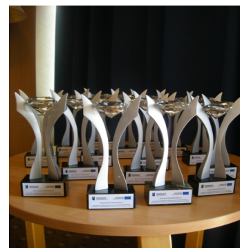
Ubiegłoroczne statuetki / fot. FIRR

Kontakt: Pani Małgorzata Domagała, malgorzata.domagala@firr.org.pl , tel. 665 883 603