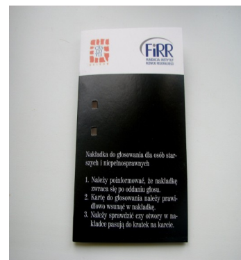
Nakładka do głosowania

FIRR od 2007 r. działa na rzecz wykorzystywania nakładek podczas wszystkich wyborów. W 2010 r. w I turze wyborów Prezydenta Polski FIRR po raz pierwszy wysłał nakładki do kilkadziesiąt osób niewidomych z całej Polski. W II turze udało się zaangażować w projekt Urząd Miasta Warszawy i Urząd Miasta Zakopane. Podczas I tury wyborów samorządowych władze Warszawy ponownie pomogły wprowadzić do swoich lokali wyborczych nakładki, tym razem na wybory Prezydenta Miasta. W II turze wyborów w Krakowie Urząd Miasta wsparł działania Fundacji, aby w głosowaniu na prezydenta mogło uczestniczyć jak najwięcej krakowian. Nakładki z powodzeniem funkcjonują w takich krajach jak Wielka Brytania, Niemcy czy Albania.