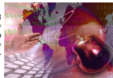
Logo Forum Dostępnej Cyberprzestrzeni