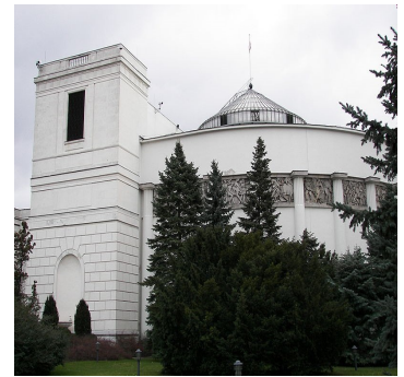
Sejm RP

Projekt Podkomisji został skierowany do Komisji Edukacji, Nauki i Młodzieży, pracom której przysłuchuje się przedstawiciel FIRR. Mamy nadzieję, że już wkrótce możliwa będzie również dobrze rokująca wzrostowi szans osób niepełnosprawnych na zdobycie wyższego wykształcenia, relacja z prac Komisji.